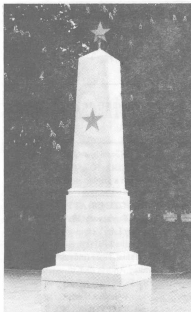
Május 9-én, a győzelem napján a Csalamádé-temetőben avatták fel a frissen felújított szovjet hősi emlékművet