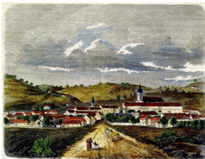
Szekszárd látképe, színezett acélmetszet

május 25., vasárnap délelőtt, hazautazás