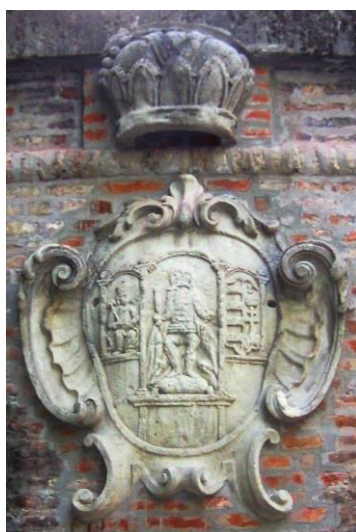
Tolna vármegye címere Szekszárdon, a vármegyeháza kerítőfalán

Tolna vármegyét is, ha van kedved, eljárd, Hol van Simontornya, Földvár, Tolna, Szekszárd, De hogy a nagy veszélyt életedre ne várd, A jó vörös bortól szád, mint lehet, elzárd!